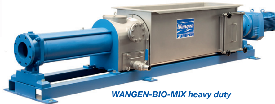
WANGEN-BIO-MIX heavy duty

BIO-MIX Pumpen mit allen gängigen Futtermischwagen, Schubboden-containern und Fütterungsschnecken kombinierbar.