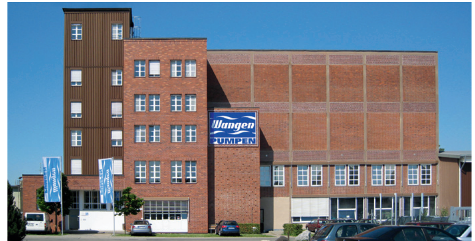
Firmensitz der Pumpenfabrik Wangen im Allgäu.

zuverlässige Förderung von Medien geht. Hohe Viskosität, abrasive Stoffe, Mehrphasengemische oder klebrige Medien werden dabei ebenso gefördert wie hochentwässerte Schlämme.