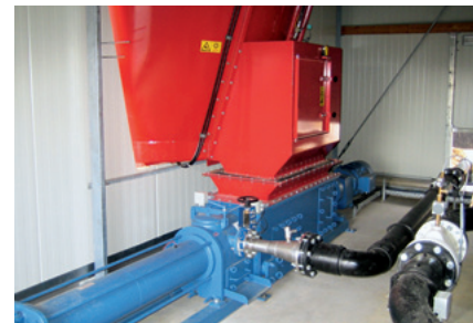
WANGEN-BIO-MIX heavy duty mit Futtermischwagen