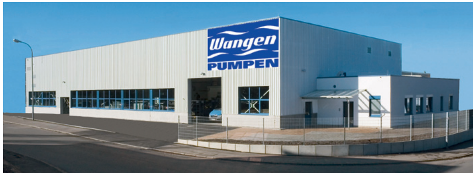
Statorenwerk am Firmensitz in Wangen im Allgäu

Wir bieten – neben einem kompletten Programm an Standardpumpen – kundenindividuelle Spezialpumpen an, die spezifisch konstruiert und gefertigt werden. WANGEN-Pumpen zeichnen sich durch hohes Qualitätsniveau und Betriebssicherheit aus. Sie werden erfolgreich in der Biogastechnik, Landwirtschaft, Lebensmitteltechnik, Industrie oder bei Kommunen eingesetzt – immer dann, wenn es um die