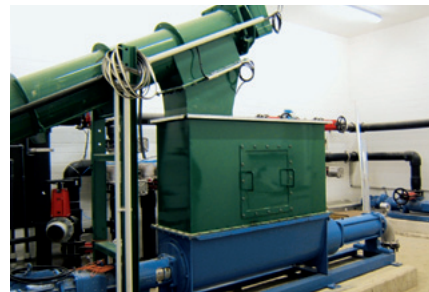
WANGEN-BIO-MIX mit Zuführschnecke