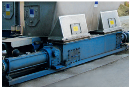
WANGEN-BIO-MIX heavy duty mit 3 m langem Rachen